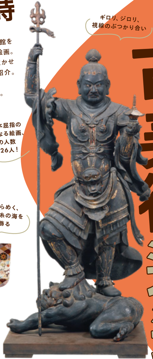
《木造毘沙門天立像》 鎌倉時代 13世紀