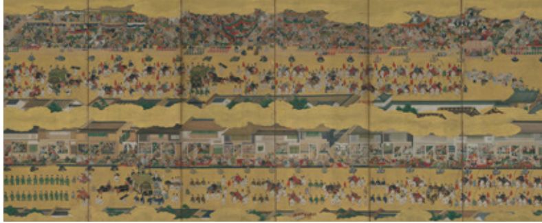
《二条城行幸図屏風》(右隻) 江戸時代 17世紀