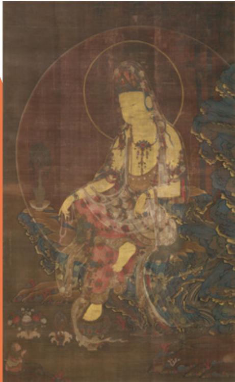
重要文化財 徐九方《水月観音像》 高麗・忠肅王10年〔至治3年〕(1323)